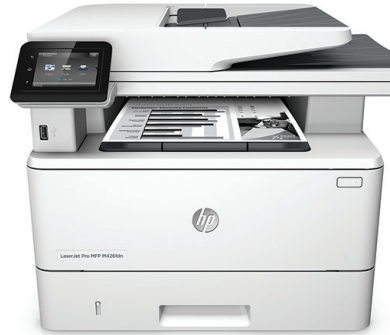
HP LaserJet Pro M426fdn többfunkciós nyomtató

Gyors nyomtatási, beolvasási, másolási és faxolási teljesítmény, valamint erőteljes, átfogó biztonsági szolgáltatások a munkájára szabva. Ez a többfunkciós készülék gyorsabban elvégzi a feladatokat, és véd a fenyegetésektől. A JetIntelligence technológiás eredeti HP tonerkazettákkal több oldal nyomtatható 2 .