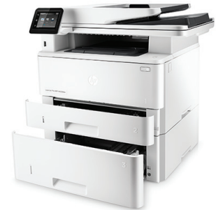
HP LaserJet Pro M426fdw opcionális 550 lapos papíradagoló-tálcával