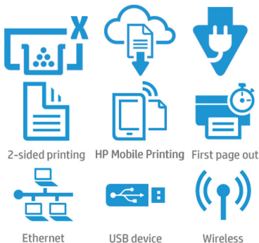
2-sided printing HP Mobile Printing First page out